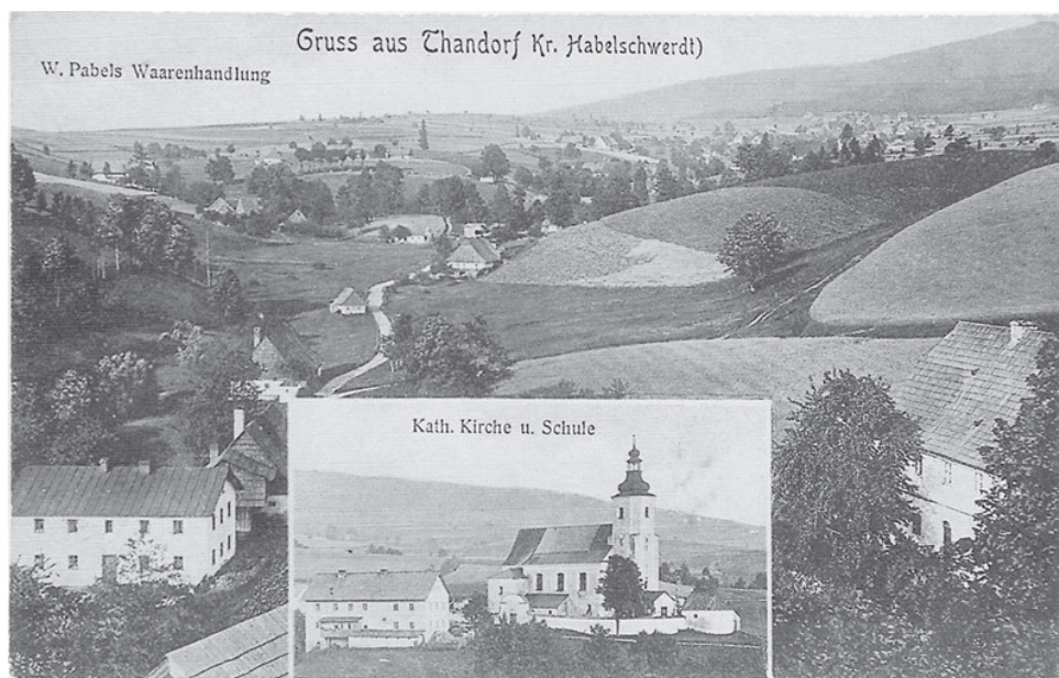
Fot. 1. Panorama Jodłowa na widokówce z 1916 r.

W tym czasie stała się jednak znanym letniskiem. Znajdowała się tu gospoda, a wielu mieszkańców wynajmowało kwatery prywatne. W okresie międzywojennym Jodłów stał się modnym ośrodkiem sportów zimowych. W górze wsi powstały dwa schroniska: narciarskie i młodzieżowe. Nie zahamowało to jednak stopniowego wyludniania miejscowości. Po II wojnie światowej w Jodłowie osiedlono repatriantów. Wieś nie odzyskała jednak poprzedniego znaczenia. W latach sześćdziesiątych XX w. powstały tu zakładowe ośrodki wypoczynkowe, które do obecnych czasów nadają miejscowości charakter letniskowy. Obecnie Jodłów liczy jedynie kilkudziesięciu mieszkańców.