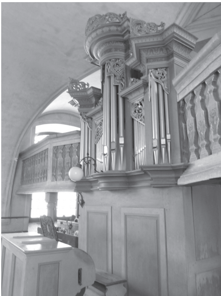
Fot. 2. Organy w kościele filialnym w Jodłowie

Głównym zadaniem chóru parafialnego było uświetnianie liturgii. Nie udało się niestety natrafić na wzmianki o składzie osobowym oraz działalności tego zespołu. Cennych informacji o wykonywanym repertuarze może dostarczyć wspo-