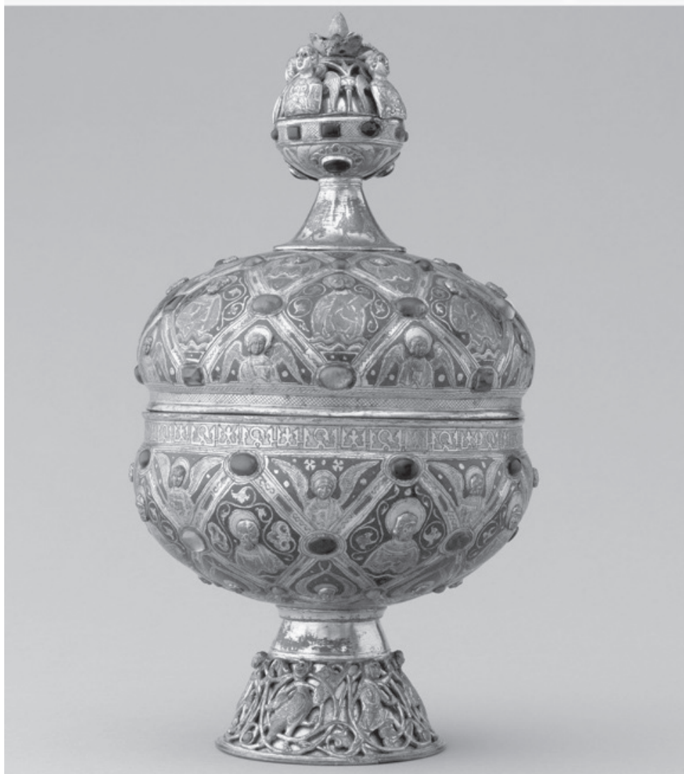
3. Cyborium, ok. 1200, złociona miedź, emalia, szklane kaboszony, Limoges, Francja. Luwr, Paryż. Fot za: L'œuvre de Limoges. Émaux limousins du Moyen Age , 1995. Paris: Éditions de la Réunion des musées nationaux