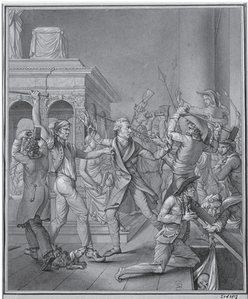
1. Pierre Lafontaine, Alexandre Lenoir sprzeciwiający się niszczeniu nagrobków królewskich w Saint-Denis, październik 1793 , 1793, rysunek, Musée Carnavalet, Histoire de Paris © Public Domain