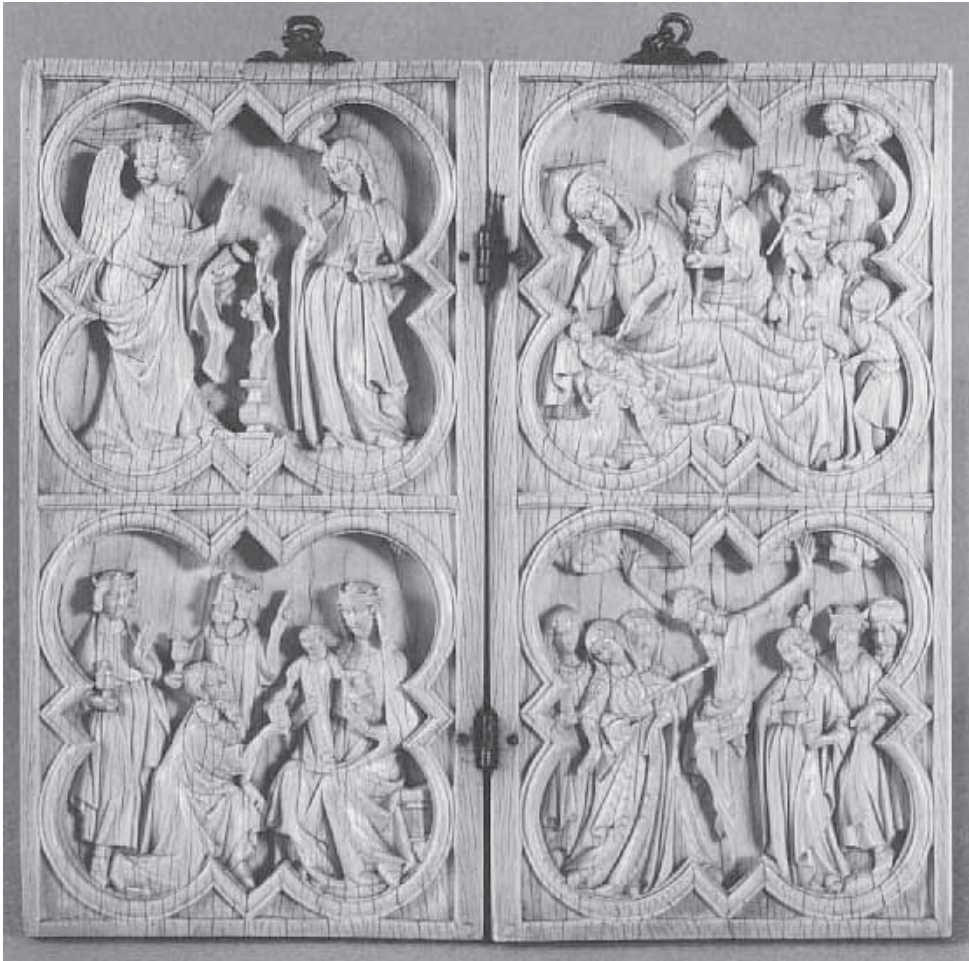
4. Dyptyk ze sceną Nawiedzenia, Narodzenia, Pokłon 3 Króli, Ukrzyżowania, 2. kwarta XIV w., kość słoniowa, Luwr, Paryż.