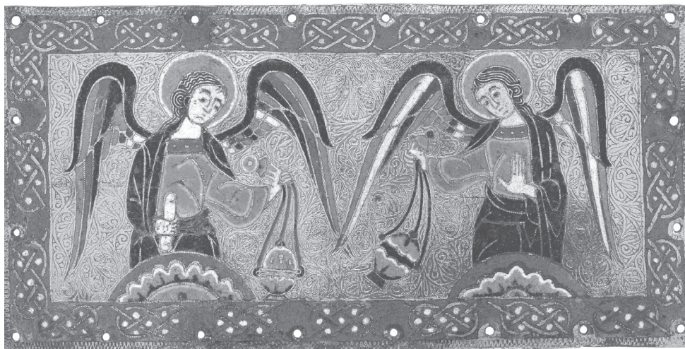
6. Plakietka Okadzające Anioły , 1170–1180, miedź, emalia żłobkowa, Francja, Limoges. The Cloisters Collection, Metropolitan Museum of Art, Nowy Jork.