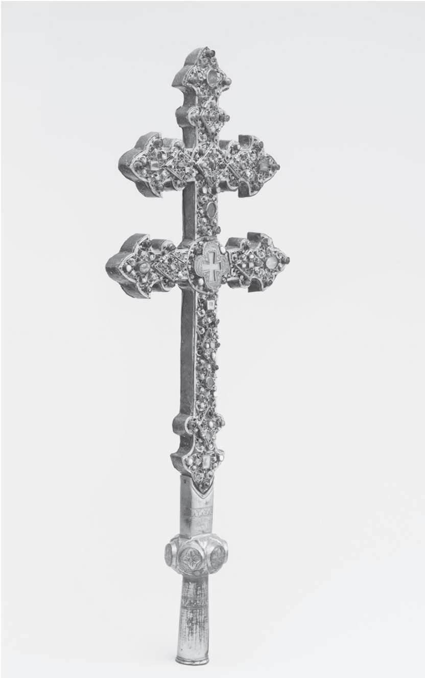
2. Krzyż relikwiarzowy zawierający niegdyś relikwie Drzewa Krzyża Świętego, filigran, kaboszony, gemmy, emalia, 3. ćwierć XIII w., Musée de Cluny, Musée national du Moyen Âge , Paryż.