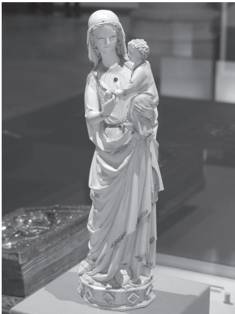
5. Figurka Maryja z Dzieciątkiem z Sainte-Chapelle , 3. kwarta XIII w. (przed 1279 r.), kość słoniowa. Luwr, Paryż.