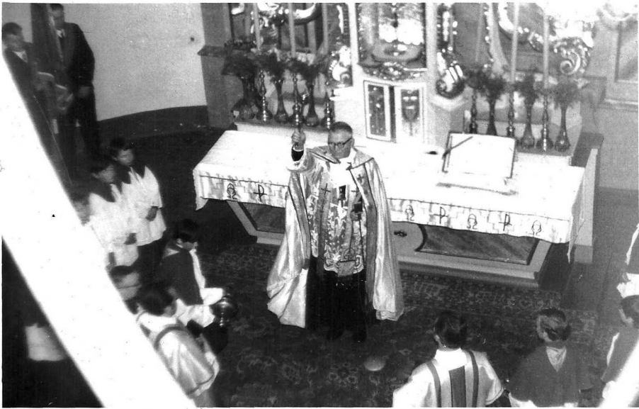
Fot. 3. Ks. Bp. Adamiuk — święci organy

Na organach wykonał: Fantazję Bacha, Preludium — Pachelbel, Mendelsson [ sic! ] — Sonata, Bach — chorał. Było to ładne, ale za trudne dla ludzi.