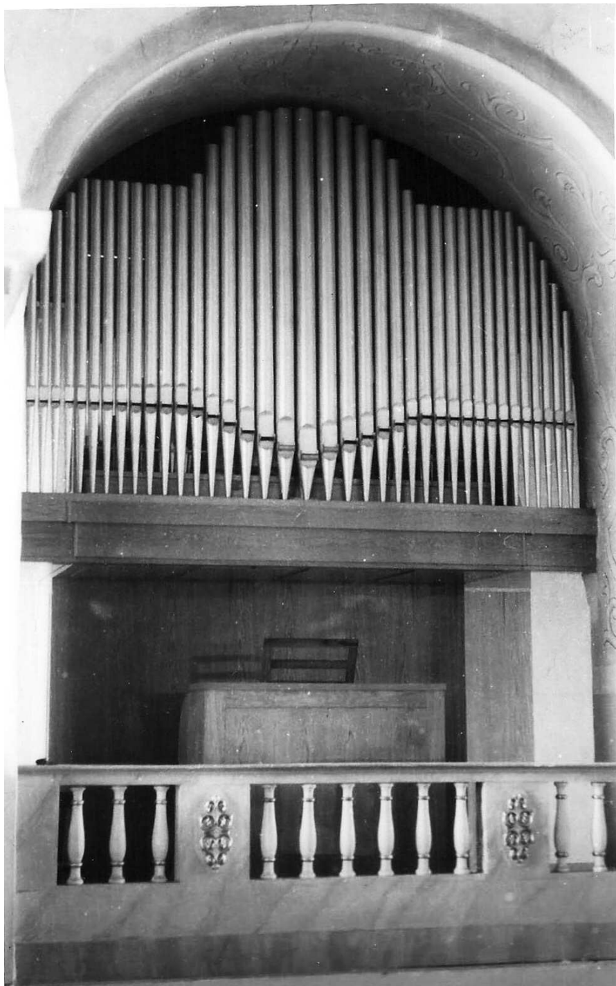
Fot. 2. Organy – Dzielów – widok z przodu