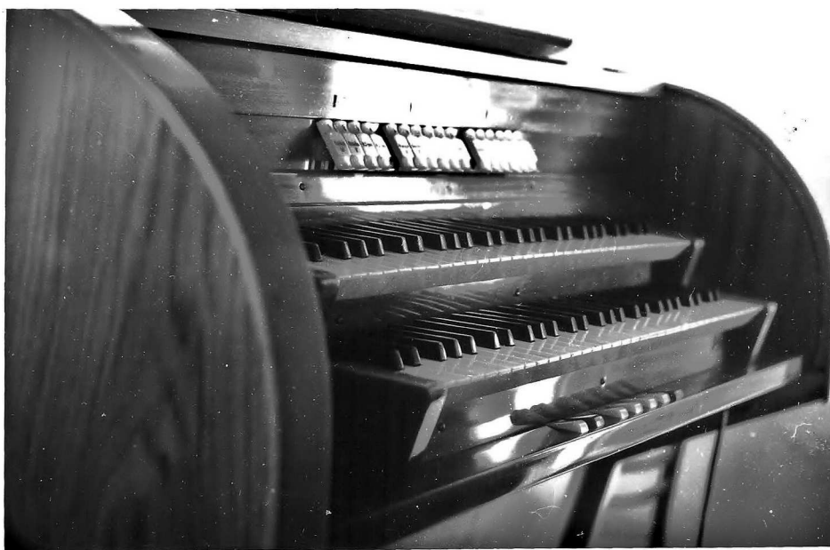
Fot. 1. Zdjęcie kontuaru z odręczną notatką ks. proboszcza

Poprzednie organy z 1884 r. – mechaniczne (Rygera z Opawy [sic!]) w czasie wojny 1945 r. zostały zniszczone (Kosztowały 2000 [lub 2080 – niewyraźnie] M)