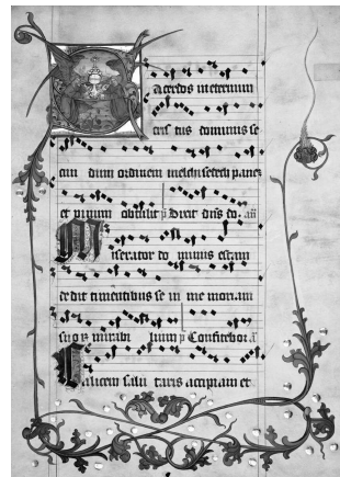
Fot. 2. Początek I Nieszporów oficjum o Bożym Ciele, rękopis EC lad. 4, Archiwum Miejskie, Bratysława