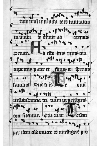
Fot. 1. Początek I Nokturnu oficjum o Trójcy Świętej, rękopis EC lad. 4, Archiwum Miejskie, Bratysława.

Pozornie wydawać by się mogło, że rozplanowanie ośmiu modi dla sześciu kompozycji nie przedstawia trudności. Wystarczy jednak przeanalizować inne przykłady, by zdać sobie sprawę z problemu, który stanowi kanwę artykułu. Oto antyfony Laudes tego samego oficjum: