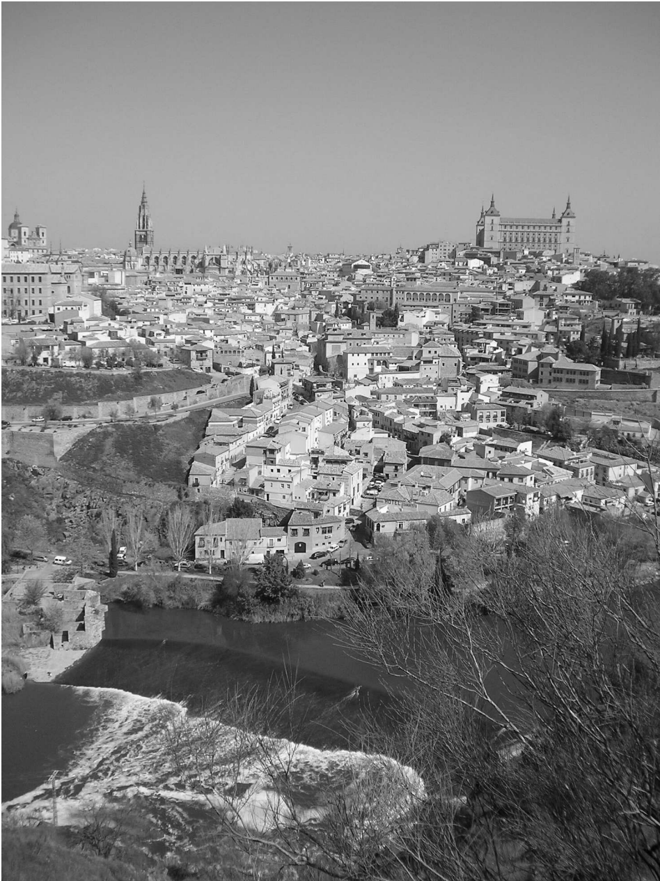
II. 2. Toledo, panorama miasta z rzeką Tag; fot. archiwum autora.